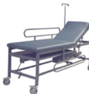
Una camilla fija